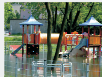
Zalany plac zabaw w Parku Miejskim Błonie tuż przed otwarciem.