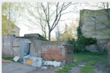
Centrum turystycznego miasta do rewitalizacji.