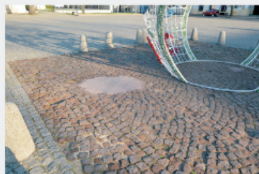
Bruk na środku Starego Rynku z ozdobą wielkanocną.